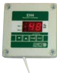
DISPLAY: RJ9 kabel, lågspänning, 25 m. Förlängningskit kablar, (max 200 m).