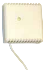
RUMSSENSOR: RJ9 kabel lågspänning, 3 m. Tilläggs-kit 25 meters RJ9 kablar (max 50 m).