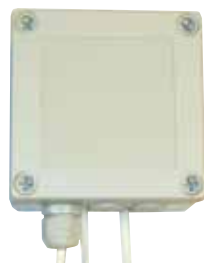
RELÄ: 230 V matning