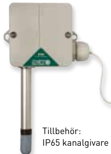
Tillbehör: IP65 kanalgivare